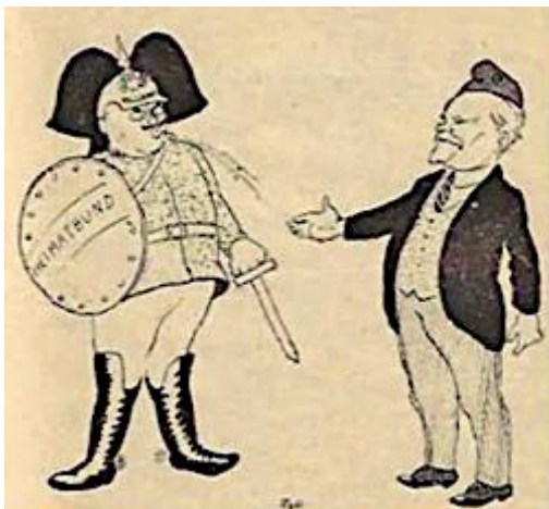
Ricklin caricaturé avec un casque à pointe face à Poincaré (Tyll)

Le 22 août 1926 est qualifié de « dimanche sanglant » : une manifestation de protestation contre les sanctions fit l'objet de violentes attaques de « mercenaires de la République », commandos se livrant à des assauts et tabassages, ainsi que de « patriotes » et de fascistes venus de régions limitrophes sous l'œil indulgent des autorités préfectorales et des forces de l'ordre. Il y eut de nombreux blessés.