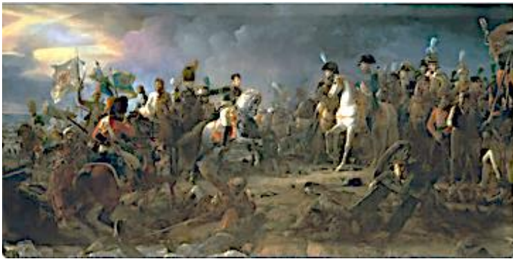
Bataille d'Austerlitz- Peinture de François Gérard (1770-1837)

Par sa position stratégique au cœur de l'Europe, l'Alsace est profondément impactée par les guerres napoléoniennes, même si les grandes batailles se déroulent essentiellement au-delà de nos frontières.