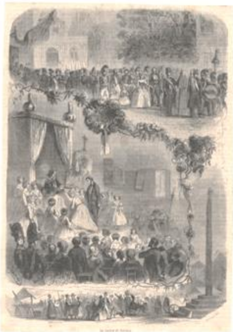
« La rosière de Selency »- Estampe, seconde moitié du XIXe siècle; Coll. Jaquet. Gallica (BnF)

L'institution par Napoléon 1 er des mariages de la Rosière est une initiative alliant propagande, politique nataliste et réinsertion sociale des vétérans de la Grande Armée.