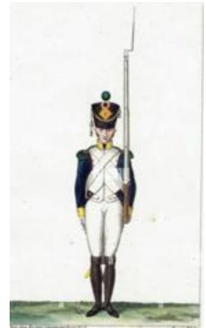
Voltigeur du 61 ème régiment d'infanterie de ligne